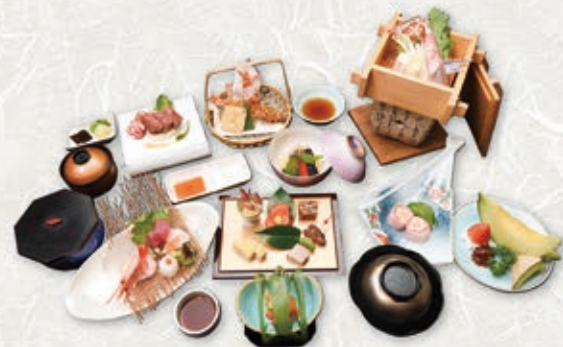
※写真は¥7,000-コースです。

本会席 ¥5,000- コース ¥6,000- コース ¥7,000- コース ¥8,000- コース