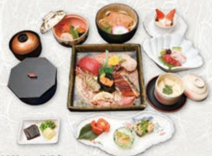
※写真は¥4,000-コースです。

本会席 ¥5,000- コース ¥6,000- コース ¥7,000- コース ¥8,000- コース